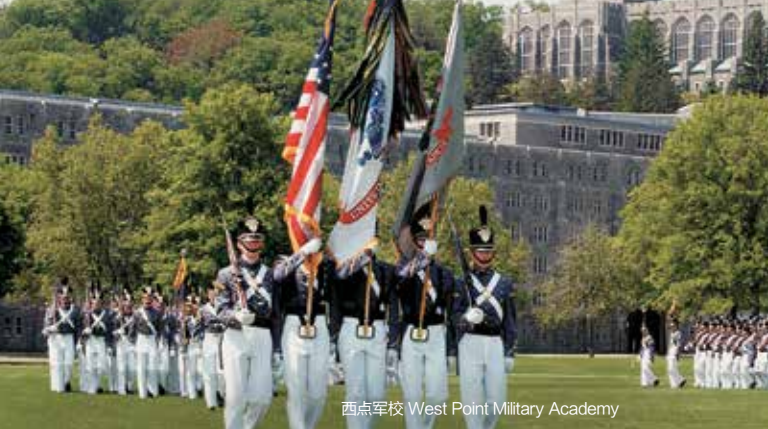
西点军校 West Point Military Academy