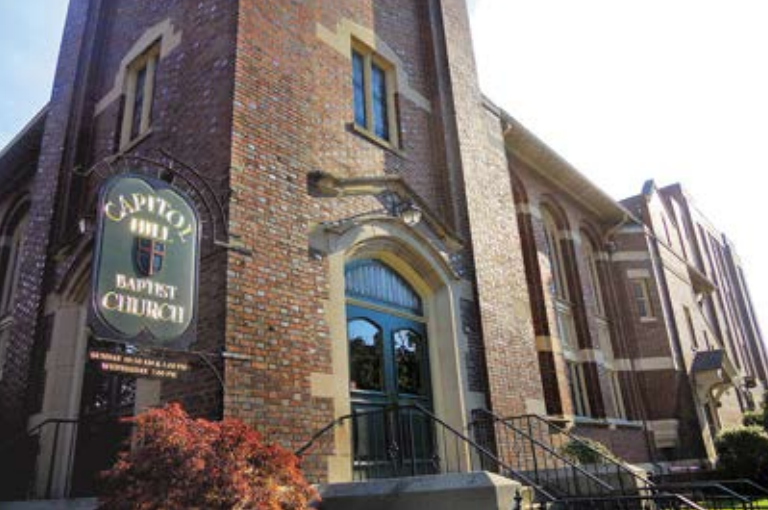
国会山基督浸礼会教堂 Capital Hill Baptist Church