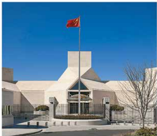
中华人民共和国驻美利坚合众国大使馆