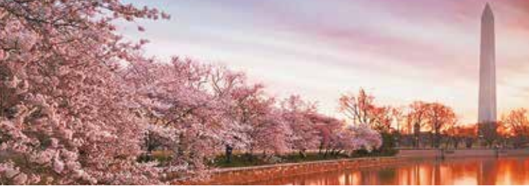
华盛顿纪念碑 Washington Monument