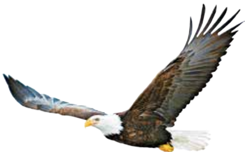
美国国鸟 Bald eagle

国家象征: 美国国花为玫瑰花 (rose), 1985年经参议院通过。国鸟为白头海雕 (秃鹰, bald eagle)。美国是世界上最先确定国鸟的国家。美国国兽为北美野牛 (bison)。