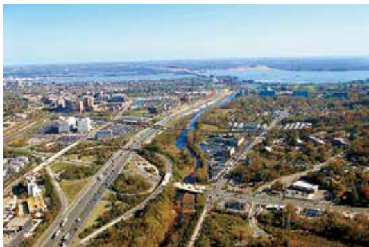
495州际高速公路 1495 Capital Beltway

2015年，美国最大的贸易伙伴是中国（16%）、加拿大（15.4%）、墨西哥（14.2%）和日本（5.2%），德国、韩国、英国、法国、中国台湾和印度紧随其后。美国被认为是世界上最大也是最重要的经济体。美国经济高度发达，全球多个国家的货币与美元挂钩，而美国的证券市场被认为是世界经济的晴雨表。