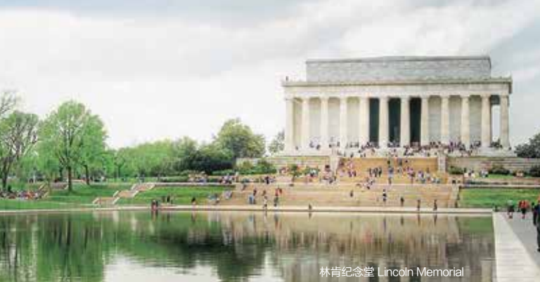
林肯纪念堂 Lincoln Memorial