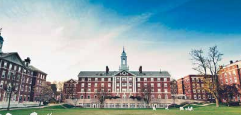
哈佛大学 Harvard University