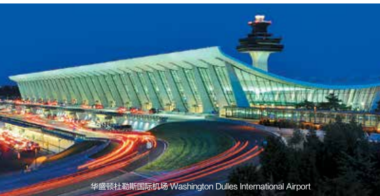
华盛顿杜勒斯国际机场 Washington Dulles International Airport

的Madam's Organ Blues Bar，位于Dupont Circle的Eighteen Street Lounge以及位于西北区U街的Black Cat,the 9:30Club和the Bhemian Cavern jazz club。U街是华盛顿的酒吧和爵士乐聚集区。华盛顿是美国朋克摇滚的重要中心，也是很多电视剧故事的发生地，这些电视剧大多数以政府机关，安全机构或者与前两者相关的机构为背景。