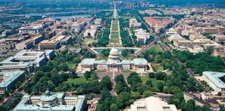
华盛顿特区鸟瞰图 Washington DC Aerial