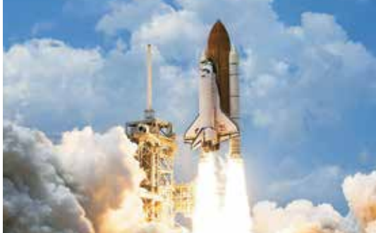
美国国家航空航天局-航天飞机 NASA Space Shuttle