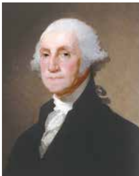
乔治·华盛顿 George Washington

美国建国后就首都的位置发生争执。北方希望将首都定在纽约，而南方希望将首都定于南方。最终南北双方作出让步，在美国南方离北方不远的地方新建一个城市作为首都。地理位置是由詹姆斯·麦迪逊（美国第四任总统）和亚历山大·汉密尔顿（宪法的起草人之一，美国的