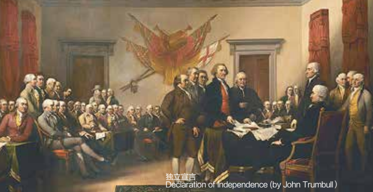
独立宣言 Declaration of Independence (by John Trumbull)